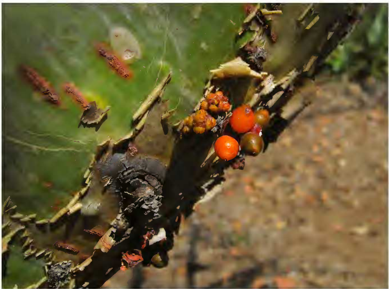
Phoradendron perredactum de Morelos.